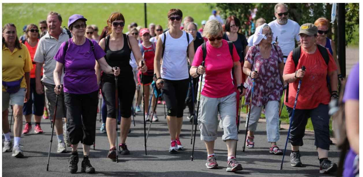
Vörå kommun har nu med ett lag i kilometertävlingen i gångstil.

– Todellakin, mutta aina on parannettavaa. Olisi hyvä, jos kunnassa olisi drop-in-päiväkotitöntekijöille, joilla on lapsia, sillä yrittäjän täytyy aina joustaa, minkä takia olisi myös tarpeen suunnitella joustavia rakenteita.