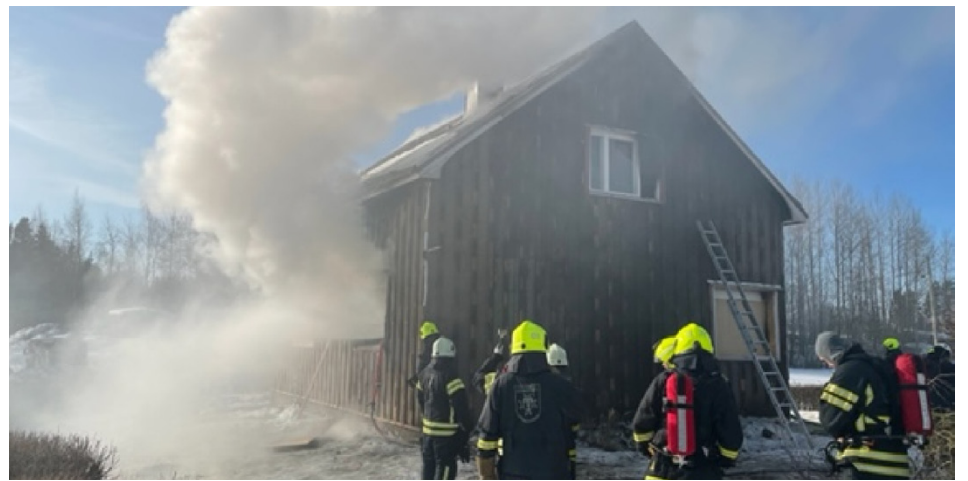
Näky on dramaattinen, mutta kyse on vain harjoituksesta. Vöyrin kunnan vapaapalokunnat harjoittelivat 12. maaliskuuta.

Kunnassa on neljä vapaapalokuntaa: Vöyrin vapaapalokunta, Maksamaan-