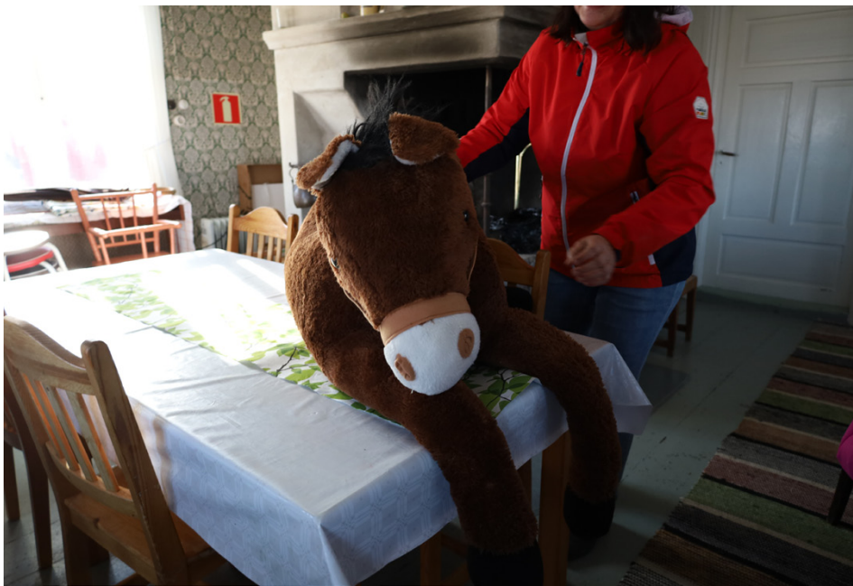
Under sommaren ska det bli käpphästklubb på Rasmusbacken. Den här hästen är inte riktigt en käpphäst, men den har ändå sin plats på gården.