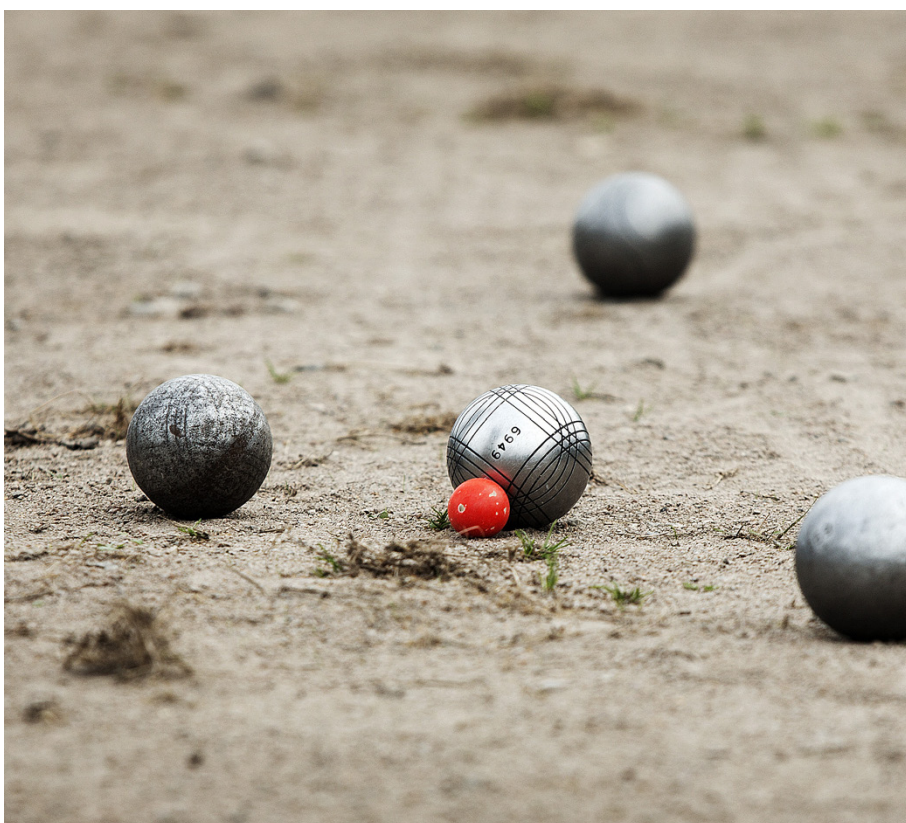
Bl.a. Petanque står på programmet för Vörå Pensionärsklubb i vår.