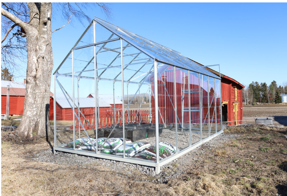
I det här växthuset ska 4H plantera växter i sommar. Det gillar barnen, säger arrangörerna.