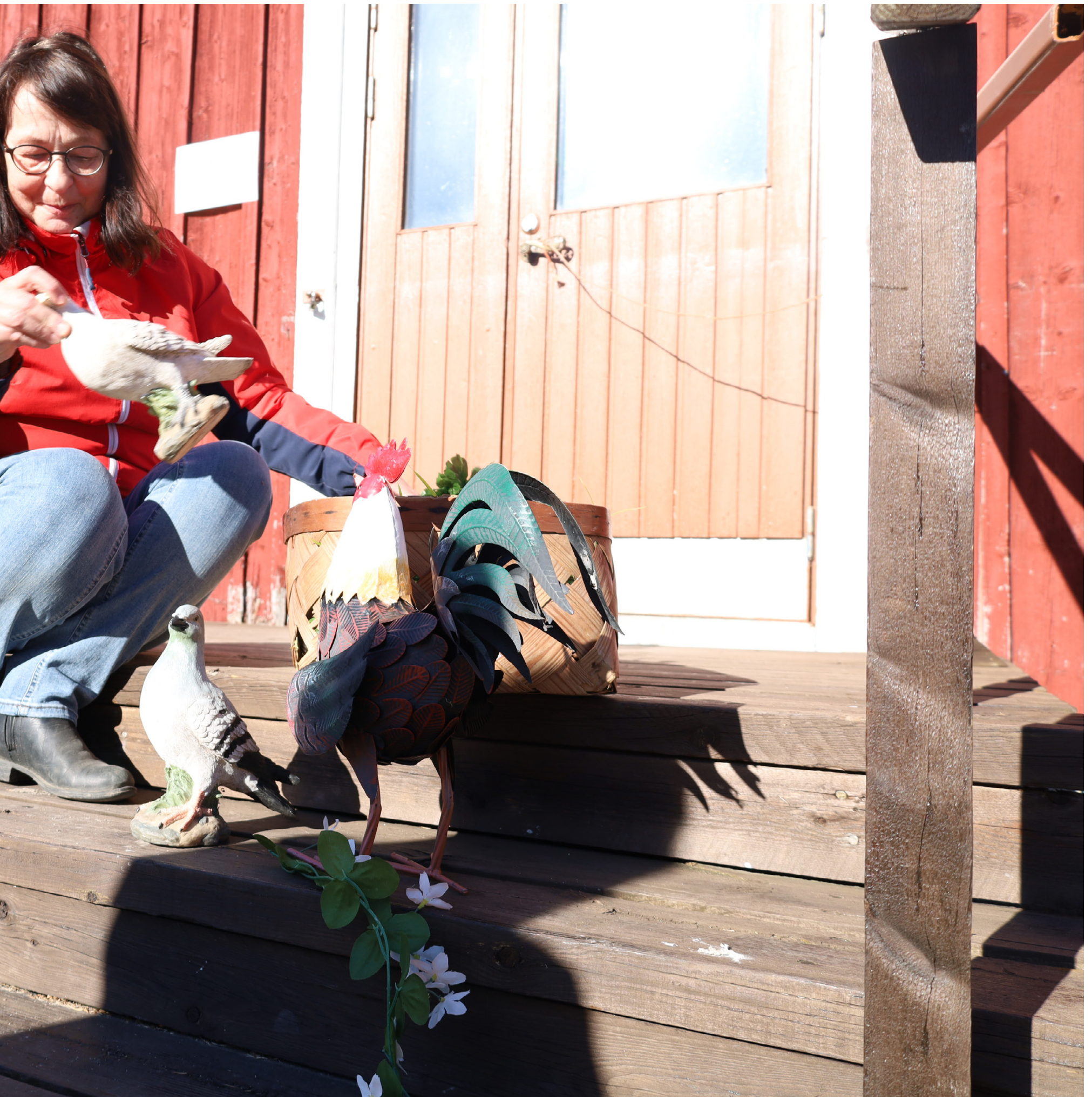
ordnar hon med sagorekvisitan.