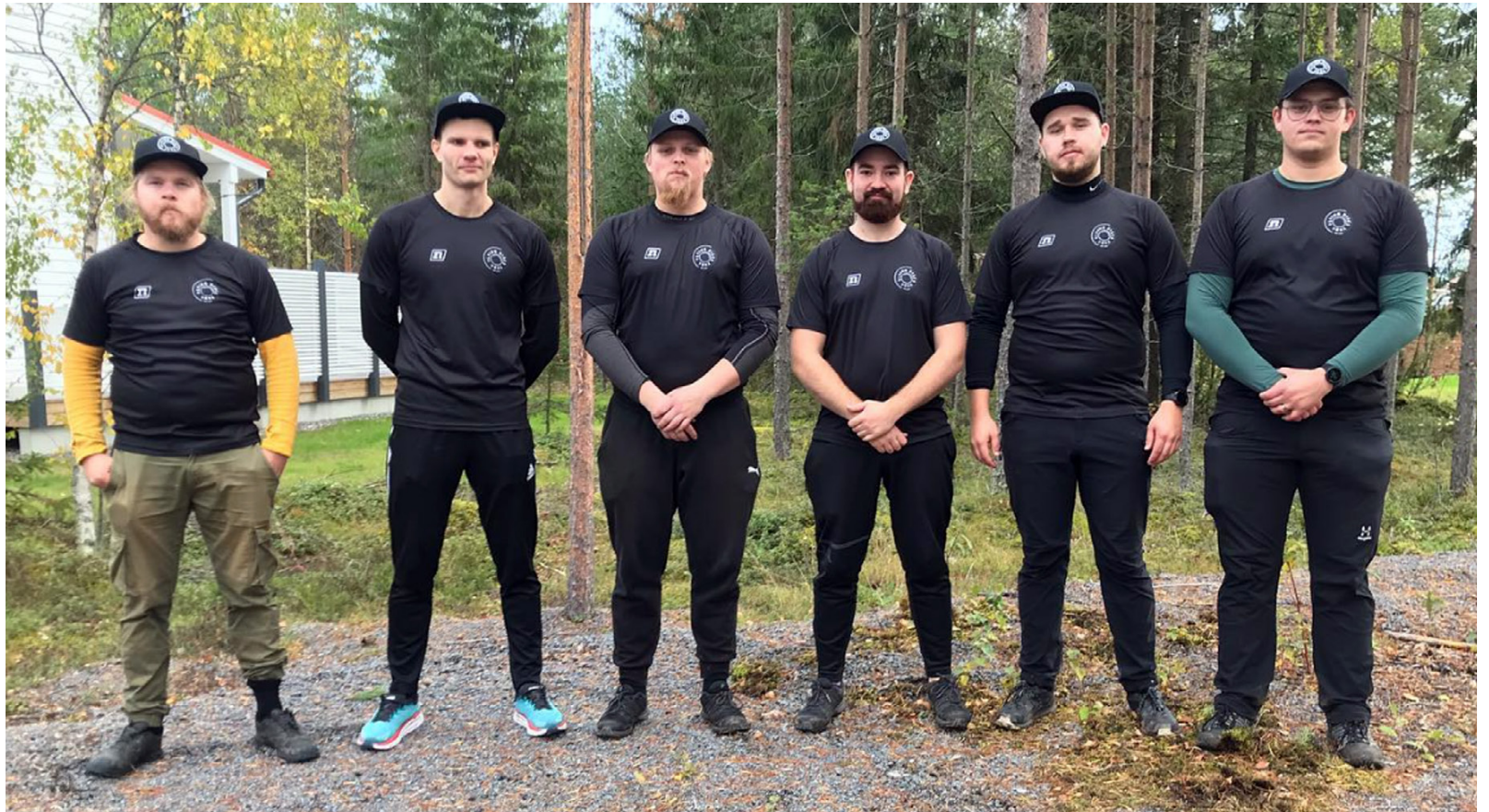
FDVs representanter i föreningskampen mellan österbottens Frisbeegolfklubbar 2021

Under sommaren 2021 påbörjades del 1 i bygget av Vörå DiscgolfPark och under sommaren hölls det 24 talkotillfällen med i snitt 5 personer per gång. Banan kunde